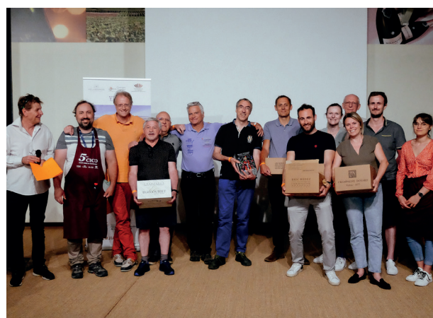
2 ème équipe VIGNYFICA / CLUB DES YVELINES