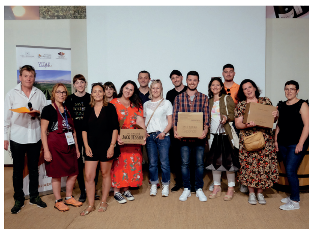
3 ème équipe SAINT VINCENT / CGP EXPERT