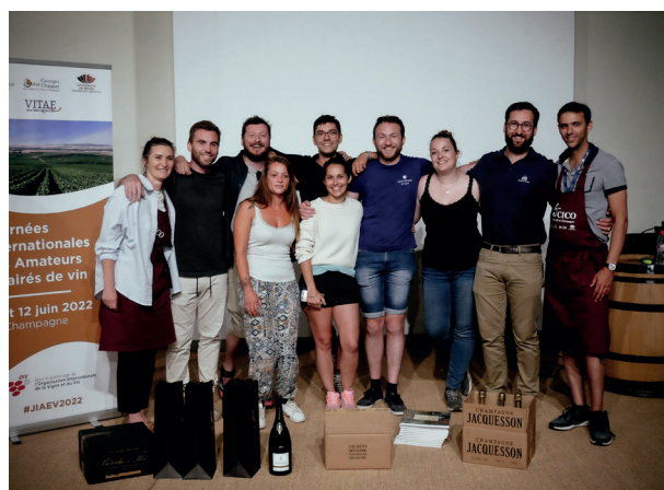
1 ère équipe LES BOURGUIGNOLS / CLUB DE BOURGOGNE